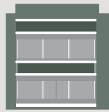
Ιδιωτική Εκπαίδευση - Κοινωνική Μέρημα