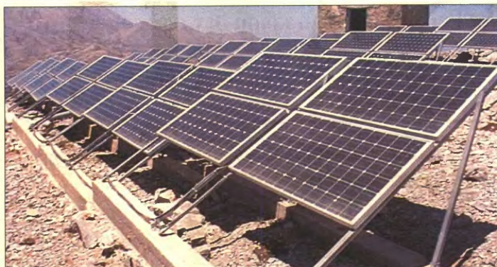
Στόχος της κυβέρνησης είναι οι επενδυτικές δαπάνες του ΕΣΠΑ να αποτελέσουν τον καταλύτη για την αναθέρμανση της επενδυτικής δραστηριότητας στη χώρα (όπως η πράσινη ενέργεια), αλλά και το αντίβαρο στη μείωση της συνολικής δαπάνης της οικονομίας, που προκαλείται από τα μέτρα δημοσιονομικής προσαρμογής που προβλέπει το τριετές πρόγραμμα.

ΑΞΙΖΕΙ να σημειωθεί ότι η νέα διαχειριστική μεθοδολογία και οι αποτελεσματικότερες διαδικασίες σχεδιασμού και παρακολούθησης της υλοποίησης του ΕΣΠΑ αναμένεται να διευκολύνουν τη διαπραγμάτευση που ήδη έχει αρχίσει με την Ευρωπαϊκή Τράπεζα Επενδύσεων για τη λήψη μεγάλου δανείου, πολυετούς διάρκειας και με χαμηλό κόστος, μέσω του οποίου θα χρηματοδοτηθεί η εθνική συμμετοχή στα Συγχρηματοδοτούμενα Προγράμματα, ώστε να απεμπόσει η προέλευση του ΕΣΠΑ από τις δυσκολίες της δημοσιονομικής συγκυρίας.