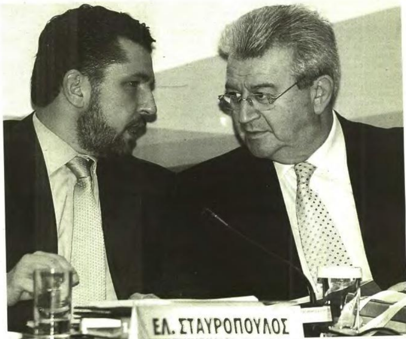
Ο ειδικός γραμματέας του Υπουργείου Ανάπτυξης και υπεύθυνος για το ΕΠΑΝ Ελευθέριος Σταυρόπουλος (αριστερά) με τον υπουργό Χρυστό Φώλια

■ Ακόμει διάφορες «φωνές», ίσως θα τις έχετε ακούσει και εσείς, από ομάδες και μεμονωμένους πολίτες στους οποίους απευθύνονται οι δράσεις του ΕΠΑΝ II, να