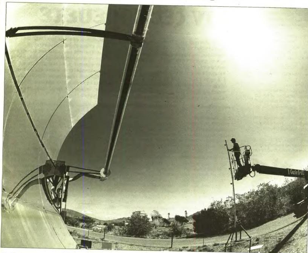
Μεταξύ των επενδύσεων που μπορούν να χρηματοδοτηθούν στην περιοχή της Περιφέρειας Δυτικής Ελλάδας είναι και η ανάπτυξη φωτοβολταϊκών πάρκων