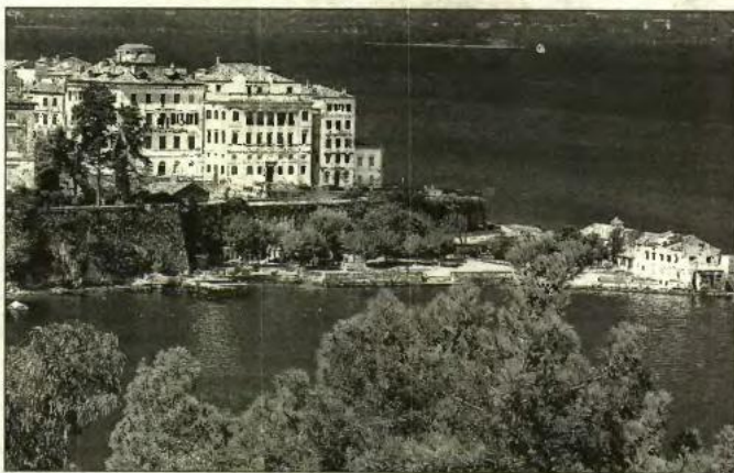
Δύο funds για την ενίσχυση των ΜμΕ

- Στο πρόγραμμα για την Ενίσχυση Μικρομεσαίων Επιχειρήσεων σε περιοχές ολοκληρωμένης Αστικής Ανάπτυξης, στους τομείς της μεταποίησης, του τουρισμού, του εμπορίου και των υπηρεσιών, υποβλήθηκαν 2.862 επενδυτικές προτάσεις οι οποίες αιτούνται δημόσια δαπάνη 170 εκατ. ευρώ. Από τις επενδύσεις αυτές υπολογίζεται ότι θα δημιουργηθούν 3.474 νέες θέσεις εργασίας. - Στο πλαίσιο του Δ' κύκλου ενίσχυσης των μικρομεσαίων επιχειρήσεων, στους τομείς του εμπορίου και των υπηρεσιών υποβλήθηκαν συνολικά 31.800 προτάσεις με προϋπολογισμό 2,4 δισ. ευρώ και αιτούμενη δημόσια δαπάνη ύψους 1,23 δισ. ευρώ. Από τις επενδύσεις αυτές υπολογίζεται ότι θα δημιουργηθούν περίπου 40.000 νέες θέσεις εργασίας. Στο πλαίσιο του προγράμματος ενίσχυσης που προκηρύχθηκε από την Κοινωνία της Πληροφορίας, για την αναβάθμιση του μηχανολογικού εξοπλισμού των ΜμΕ υποβλήθηκαν 401 επενδυτικά σχέδια προϋπολογισμού 34 εκατ. ευρώ και αιτούμενη δημόσια δαπάνη 17 εκατ. ευρώ.