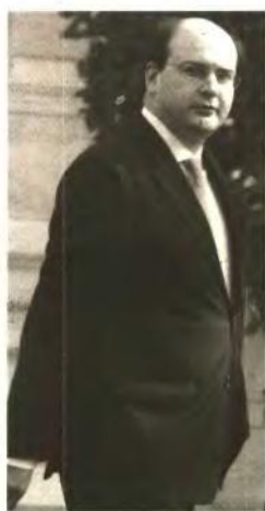
ΤΟΥ ΤΙΜΟΛΕΩΝΤΟΣ ΑΡΚΕΝΤΗ

Τρία νέα κοινοτικά προγράμματα συνολικού προϋπολογισμού 184 εκατ. ευρώ εκ των οποίων τα 92 εκατ. αποτελούν δημόσια δαπάνη και αφορούν σε επιδοτήσεις για τον εκσυγχρονισμό των επιχειρήσεων ανακοίνωσε ο υπουργός Ανάπτυξης Κωστής Χατζηδάκης